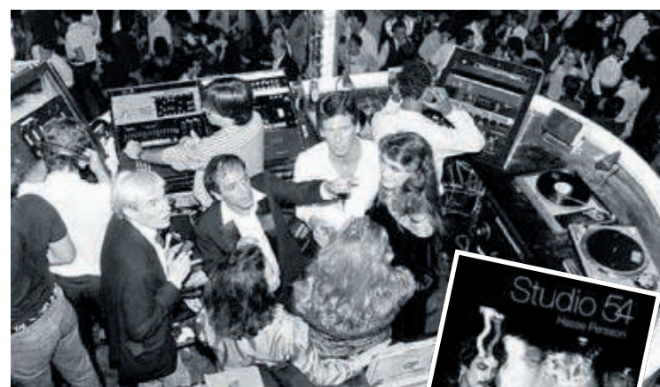
I PROTAGONISTI Calvin Klein, Brooke Shields, Steve Rubell and Andy Warhol nella console del Dj nel 1979 allo Studio 54 di New York. Accanto la copertina del libro