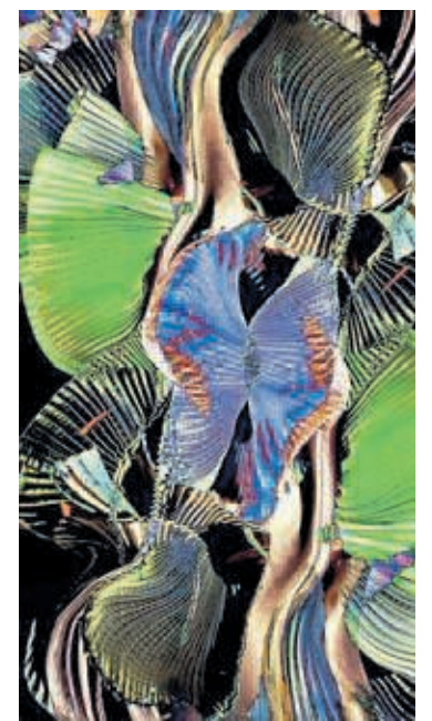
MAYA Pirotecnica partitura cromatica andante con moto