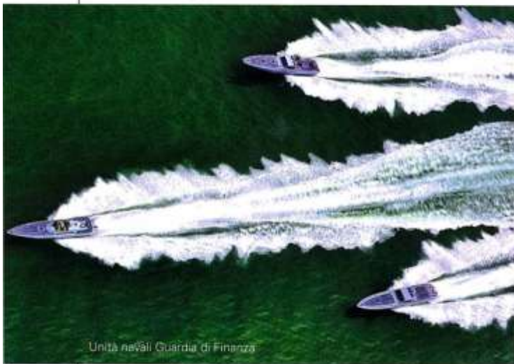
Unità navali Guardia di Finanza

U n mago dell'immagine, tra i maggiori esponenti italiani di fotografia d'arte e industriale, ma anche uno straordinario ritrattista di luoghi. Sono di Edoardo Montaina i volumi fotografici I Fori Imperiali e La Galleria Borghese (commissionati da Enel) Le Scuderie Papali (realizzato per il MI-BAC), ma anche la lettura di Roma notturna, E luce fu... , pubblicato per conto di Acea. Poliedrico e geniale, Montaina ha realizzato campagne pubblicitarie di aziende come Ford, Fiat, Fiorucci, Lottomatica e Telecom, ha rivisitato le espressioni corporate identity per Ansaldo STS, Enel, Finmeccanica,