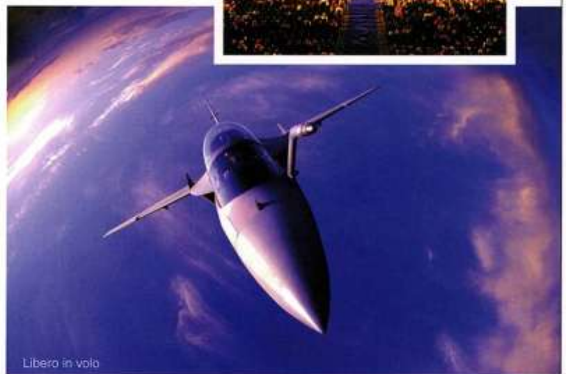
Libero in volo